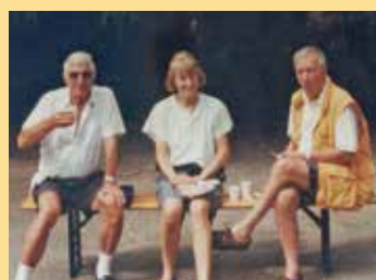
Pause beim Bouleturnier 2001