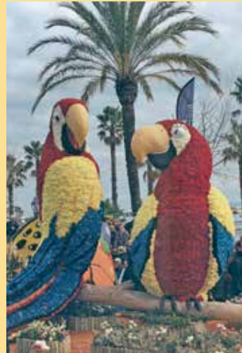
2016: Unzertrennlliche Freunde