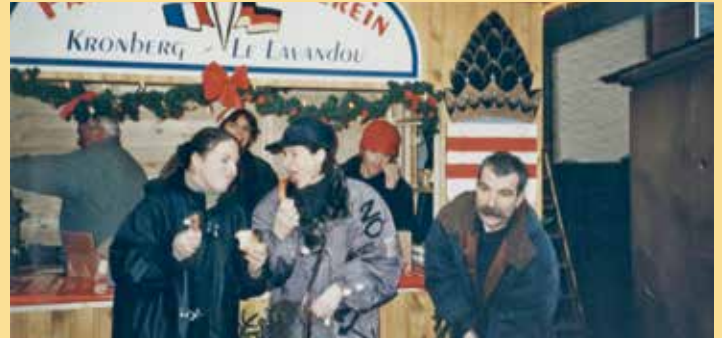
1999: Weihnachtsmarkt in Kronberg