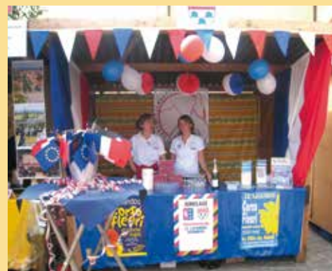
2011: Europatag in Kronberg