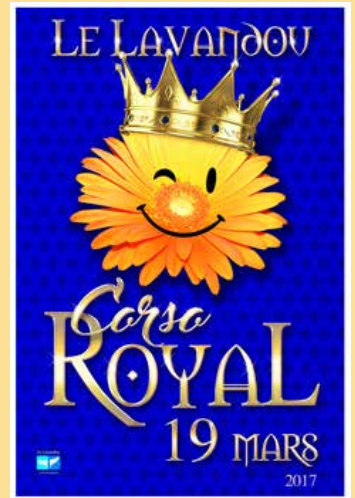
Corso Royal Plakat 2017