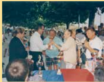
Bouleturnier zum Jubiläum 1998