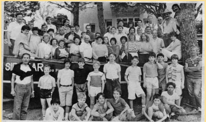
La grande famille de l'E.F.C. Kronberg photographée au SIDEVAR

In den 80er-Jahren fanden viele Jugend-Fußballturniere statt.