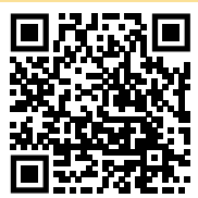
2019 geht die Website online