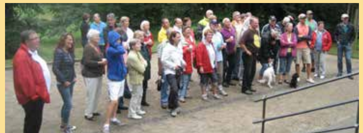
2013: Warten auf die Siegerehrung