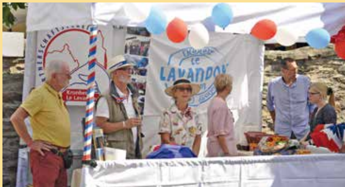
14. Juli 2018 der Nationalfeiertag als Straßenfest in der Fußgängerzone