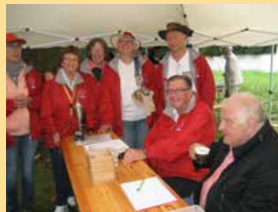
2016: Der Pokal steht bereit