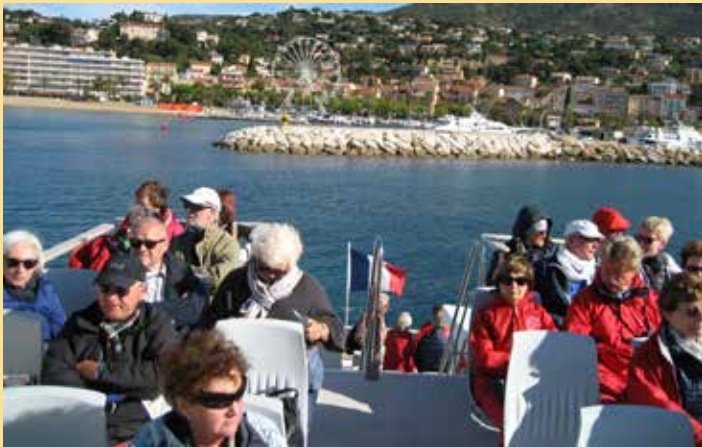
2018: Camargue und Côte d'Azur in 12 Tagen