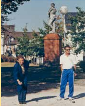
Boulespiel Jubiläum 1997