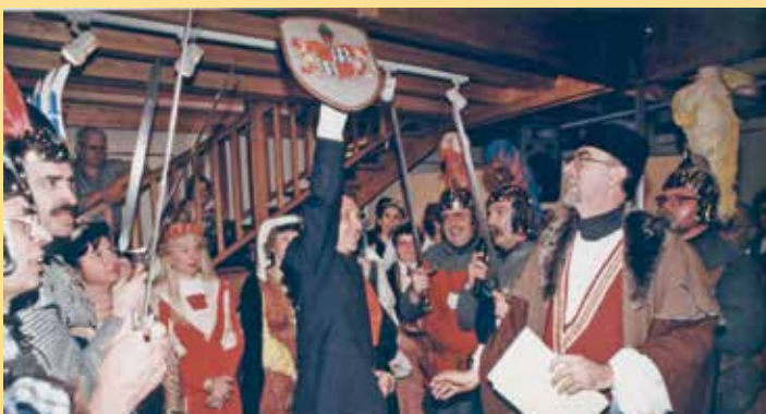
1999: Die Kronberger Ritter fahren zum Corso Fleuri