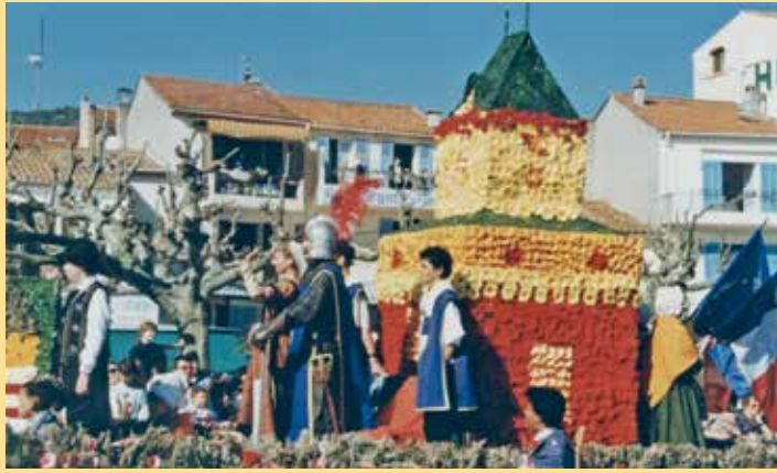
1997: Im Zeichen der Kronberger Burg