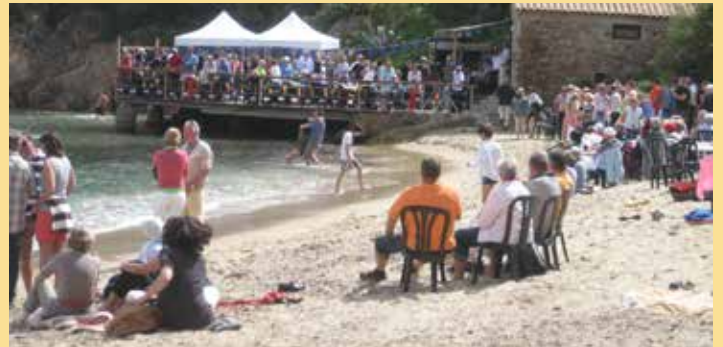
Am Strand von Le Layet gibt es eine „Sardinade & Grillade“ für 350 Personen