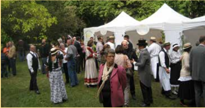
Picknick im Victoriapark