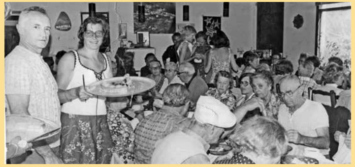
1977 – Das Jugendrotkreuz bewirbt Le Fougau in der Grand Bastide