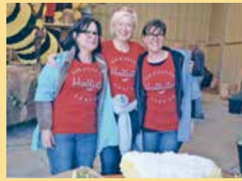
2014: erst die Arbeit ... ... dann das Vergnügen!