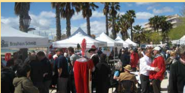
Der bewährte Marché de Kronberg findet in Le Lavandou erneut großen Zuspruch

„Noch nie seit dem Zweiten Weltkrieg war Europa so wichtig. Und doch war Europa noch nie in so großer Gefahr.“