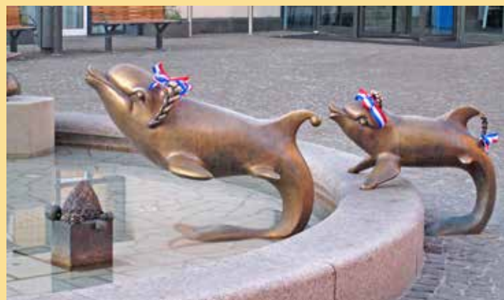
2010: Einweihung Partnerschaftsbrunnen