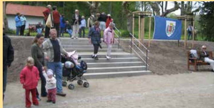
2008: Einweihung der Bouleplätze im Kronthal