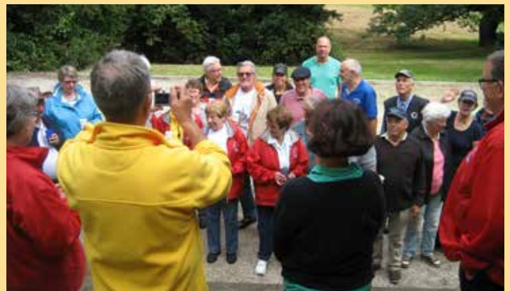
2016: vor der Siegerehrung