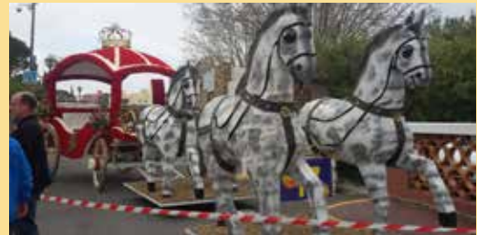
2017: Prunkwagen der Miss Lavandou