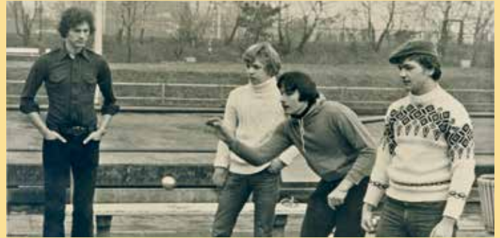
1977 – Gründung des Bouleclub in Kronberg – einer der ersten in Hessen

1979 sendet im August der Saarländische Rundfunk aus Le Lavandou zur Partnerschaft und 70 Kronberger sind „mit auf Sendung“.