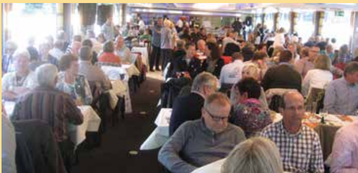
Eine Rheinfahrt erfreut die französischen Freunde