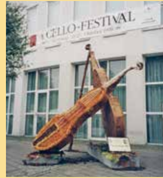
1999: Cello-Festival mit „Blüten“- Instrumenten