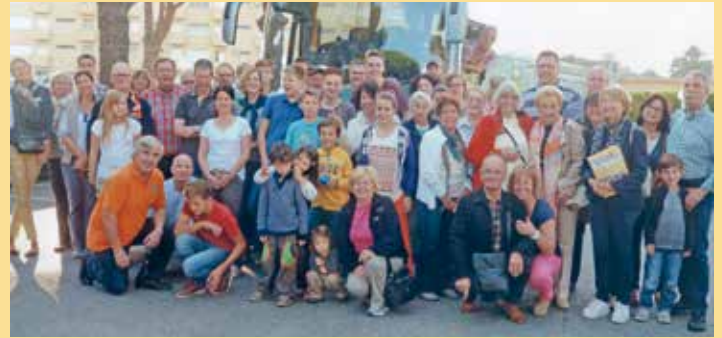
2014 lösen die Familienfahrten mit der „voyage des souvenirs“ die klassische Herbstfahrt ab.