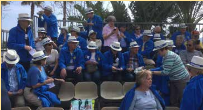
2017: Corso Fleuri – Tribünenplätze