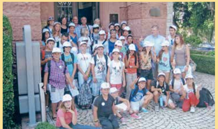
2013 und 2017: Besuch von Jugendgruppen aus Le Lavandou / Centre des Loisirs

2014: Bürgerpreis für die vier Partnerschaftsvereine