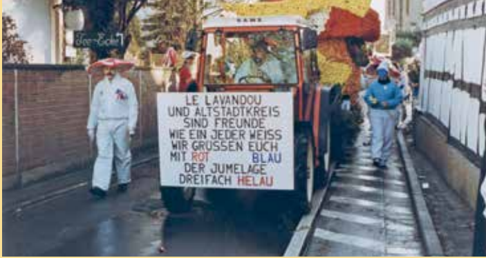
1999: Faschingsumzug in Oberhöchstadt