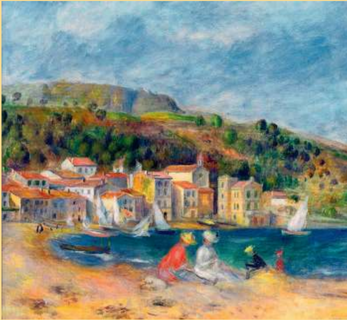
Pierre-Auguste Renoir | La plage du Lavandou, 1894