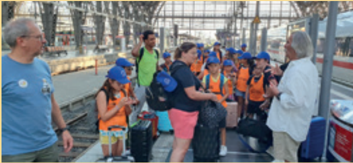
Ankunft der Gruppe mit dem ICE in Frankfurt