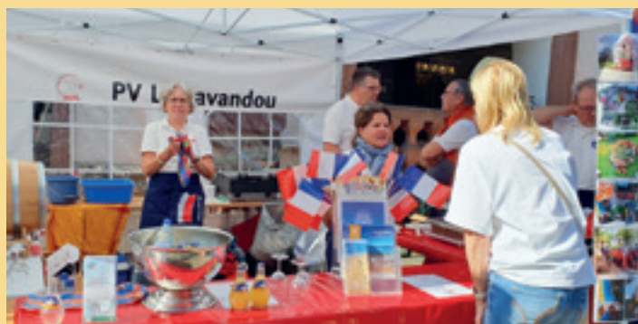
21. September: Auch hier war unser Partnerschaftsverein mit einem Stand präsent.