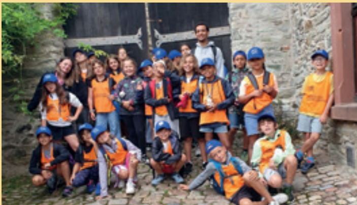
Spannende Geschichten rund um die Burg Kronberg