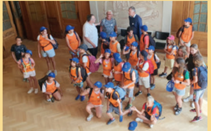
Empfang im Kronberger Rathaus