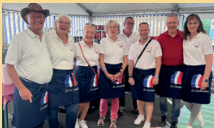
Arbeitseinsatz im Festzelt, der Spaß machte...