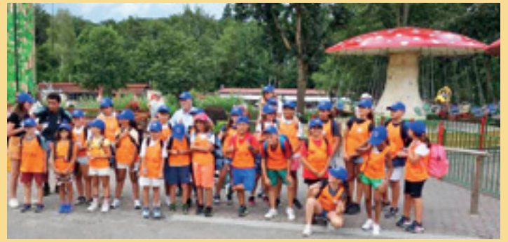
Nach dem Besuch der Saalburg hatten die Kinder viel Spaß in der Lochmühle und auch ein Besuch im Opel-Zoo durfte nicht fehlen.