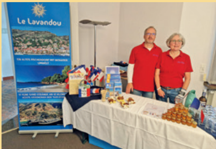
18. Mai: Ein Familienfest im Rathaus bei schlechtem Wetter aber guter Stimmung...