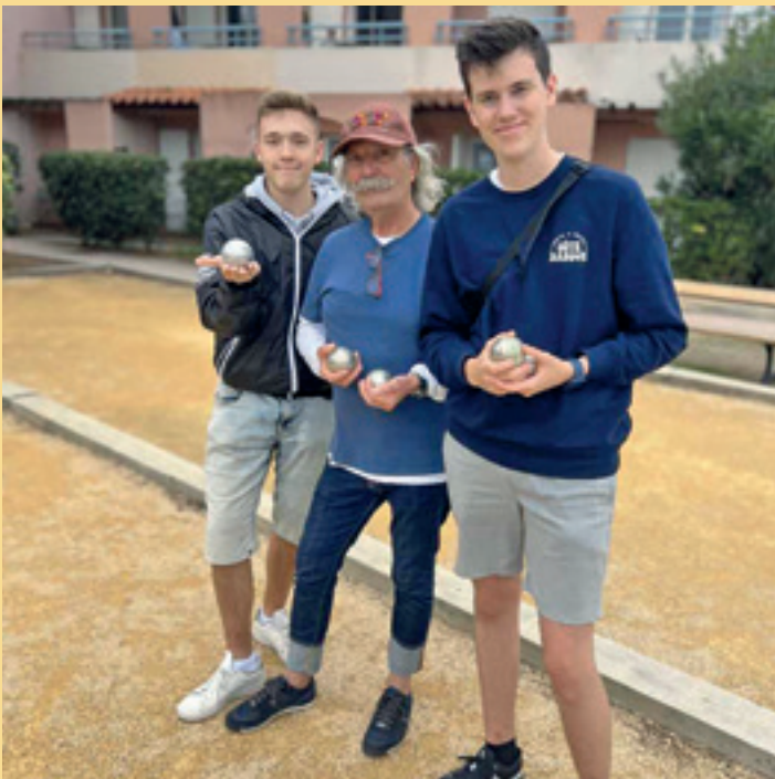
Boulespiel in der Ferienanlage L'Oustal del Mar

Die Fahrt nach Le Lavandou in den Herbstferien hat auch nach Jahren nicht an Attraktivität verloren, wieder war kein Platz im Bus mehr frei. Das ungewohnt wechselhafte Wetter tat der guten Stimmung keinen Abbruch.