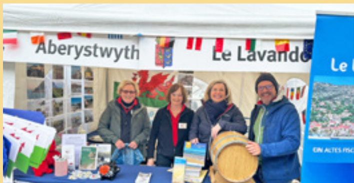
4. Mai: Gemeinsame Teilnahme der Partnerschaftsvereine in Schmitten